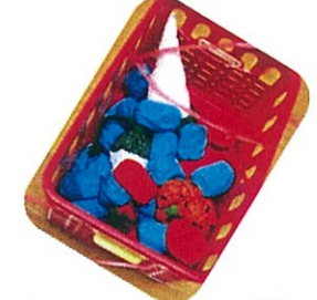
ホラかごにいっぱい!