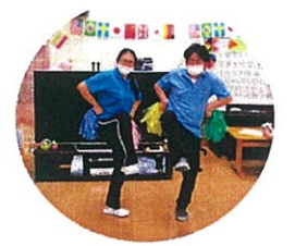
フリーフリー紅組! ガンバレガンバレ白組! 職員の応援にも 力がはいります