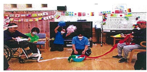
ヨーイ・ドン ひっぱれひっぱれ～