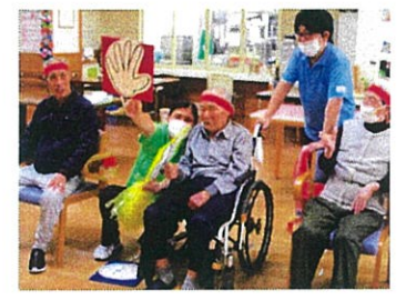
じゃんけんぽん、勝った～!

秋といえば食欲の秋や読書の秋などありますがスポーツの秋もありますね。そこでしゃりん梅ではミニ運動会を行いました。楽しく身体を動かしながら利用者さんや職員との交流を深め、また皆さんの日ごろ隠しておられる本当の力を見せていただきました。紅組と白組に分かれそれぞれの代表の方に選手宣誓をして頂き、「エイエイオー」と気合が入りスタートです!種目はじゃんけん合戦、つなひき、そして玉入れ合戦を行いました。応援合戦もありにぎやかに楽しい運動会が行われました。