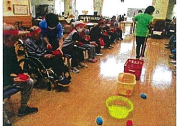
玉入れ合戦!! はいったかな～