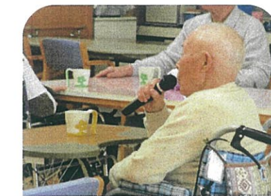
今日も喉の調子 絶好調！