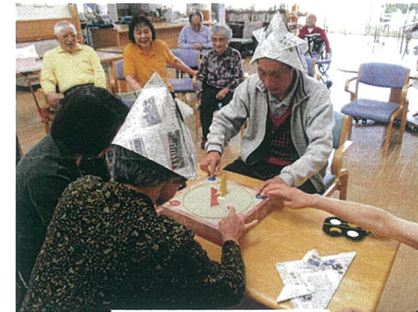
どちらが優勢かな！