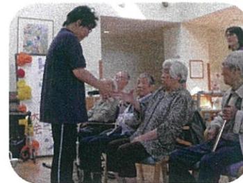
「じゃんけんリレー」