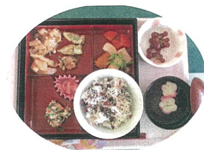
昼食には、お赤飯のお祝い弁当を召し上がっていただきました。