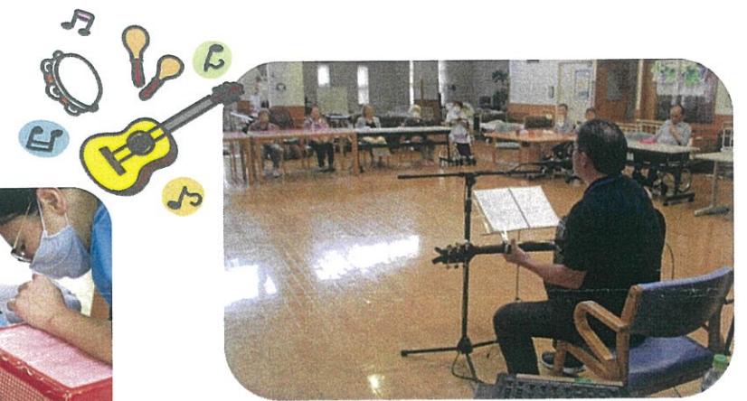
<ギターの演奏と歌> ギターの弾き語りを聴いて頂きました。ギターの音色にうっとり聴き聞いていました。

<ジェスチャーゲーム> 利用者様に、職員の名前とお題の書いてある紙をくじ引きで選んでいただき、職員がなんの動きをまねているのか当ててもらうゲームです。例えば田植えやにわとりなどいろいろなお題がありましたが、皆さんすぐにわかったようで答えられていました。