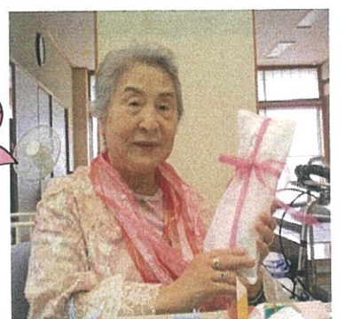
ささやかな祝いの品として「長寿祈願箸」を贈らせて頂きました。お使いください。